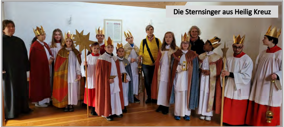
Die Sternsinger aus Heilig Kreuz