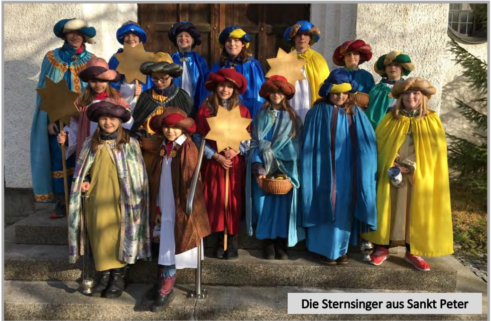
Die Sternsinger aus Sankt Peter

„Kinder stärken, Kinder schützen“ lautete das diesjährige Motto. Und mit dem gesammelten Geld können unsere Kinder und Jugendlichen, die so fleißig mit ihren Betreuern unterwegs waren, wirklich sehr viel dazu beitragen.